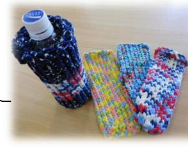
ペットボトルホルダー (M・Aさん) →