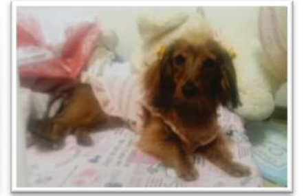
↑ウラン(飼犬)の写真