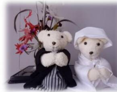
←ウエディングベア (A・Mさん)