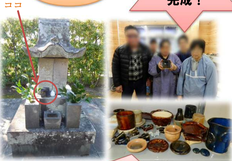
他にも個性豊かな作品がたくさん！