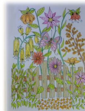
↑塗り絵 (H. Yさん)