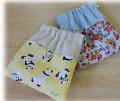
↑ポーチ (H. Sさん)