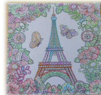
↑塗り絵 (S. Aさん)