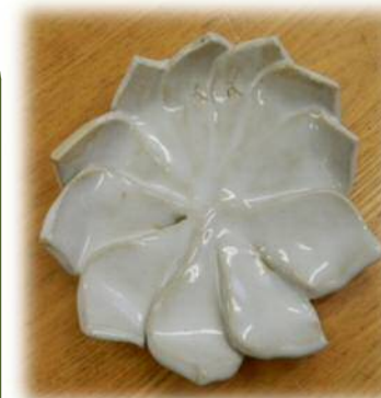
↑陶芸作品 (K. Kさん)