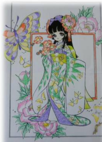
↑塗り絵 (Y. Hさん)