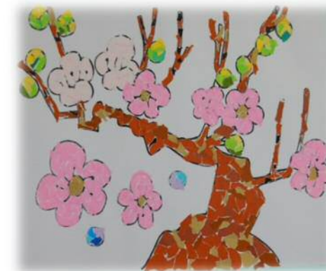
↑貼り絵 (N. Aさん)