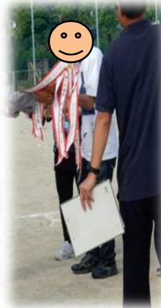
優勝トロフィー・賞状・景品を頂きました!