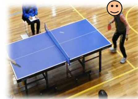
皆さんとても真剣な表情です!