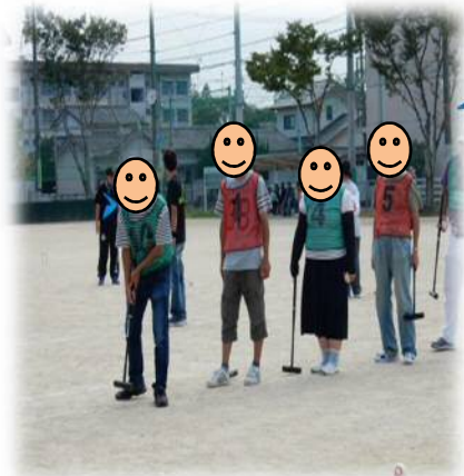
第1ゲート通過狙って…!