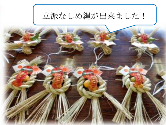
立派なしめ縄が出来ました！