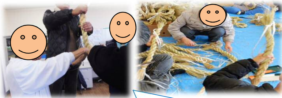
わらを編んで、丁寧に整えていきます