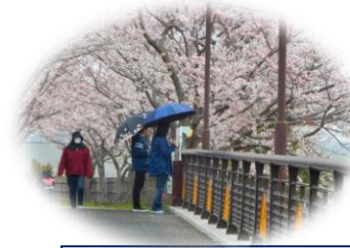
桜見学 (4月) サイクルロードにて