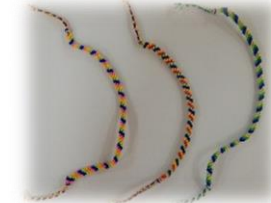
ミサンガ (匿名希望)

デイケア活動で作った作品です。樟風祭や精神保健福祉大会に出品し日頃の成果を発表しています。