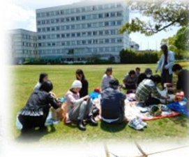
つつじ見学 (5月) 百年公園にて